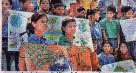
स्कालर्स होम में पोस्टर प्रतियोगिता में शिरकत करते छात्र।