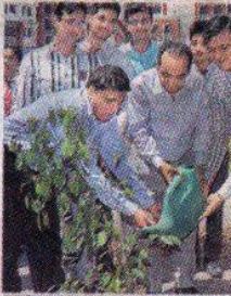
ग्राफिक एरा में पौधारोपण करते शिक्षक और छात्र।