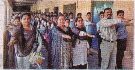
एसजीआरआर पीजी कालेज में शपथ लेते शिक्षक और छात्र।