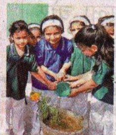
अर्थ डे के अवसर पर इंडियन अकादमी में पौधारोपण करते बच्चे।