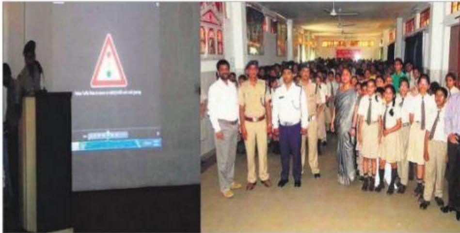
Participants at the workshop on traffic rules and road safety held at Indian Academy in Dehradun

The questions of young students regarding road safety and traffic rules were answered along with a small audio-video clip.