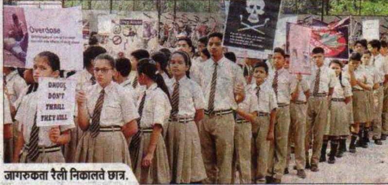
जागरूकता रैली निकालते छात्र.